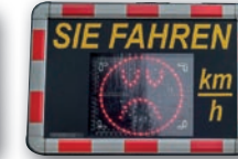
UND NICHT SO!!!